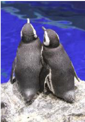
仲むつまじいペンギンのカップル

期間中、繋ぐ手をケアするイベントや、『ポーラザハンドクリーム』が当たる「愛のペンギンQ」を実施します。ペンギンの恋が盛り上がるこの時期に、来館されるみなさまも手を繋ぎ、HAPPYなひと時を過ごしていただきたいと考えています。