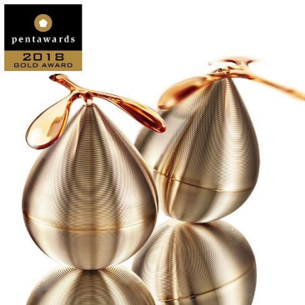
2017年10月発売 V リゾネイティッククリーム

『これからの「美」は個人の外見や内面にとどまらず周囲にも、ポジティブな影響を与えるもの』というブランド思想に基づき、揺れる要素を取り入れ、周囲と響き合う「共鳴」を表現したデザイン。