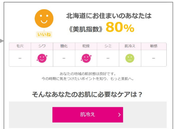
各地域の肌の状態とお手入れ方法までを提案