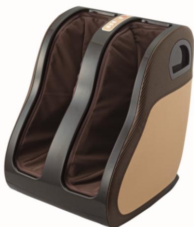
フットかっさα ¥64,000 (税込¥69,120)

全国のポーラレディ、コスメ&エステショップ「ポーラ ザ ビューティ」約620店を含む全国約4800店舗のポーラのお店で、カタログ販売にてお取り扱いします。百貨店でのお取り扱いはありません。