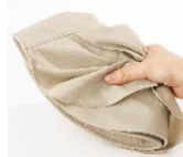
コンパクトに畳める。